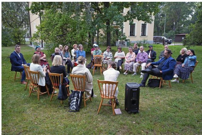
Apkaimes iedzīvotāju tikšanās par ideju konkursu “Mans kultūrdārzs Bolderājā”

RCB iesaistījās RVP aģentūras “Rīgas enerģētikas aģentūra” izsludinātajā iedzīvotāju ideju konkursā “Mans kultūrdārzs Bolderājā” ( Bolderājas bibliotēkas dārzā taps jauns labiekārtojums bibliotēkas pakalpojumu un kultūras norišu baudīšanai – Rīgas Enerģētikas Aģentūra ). Ideju konkurss tiek īstenots