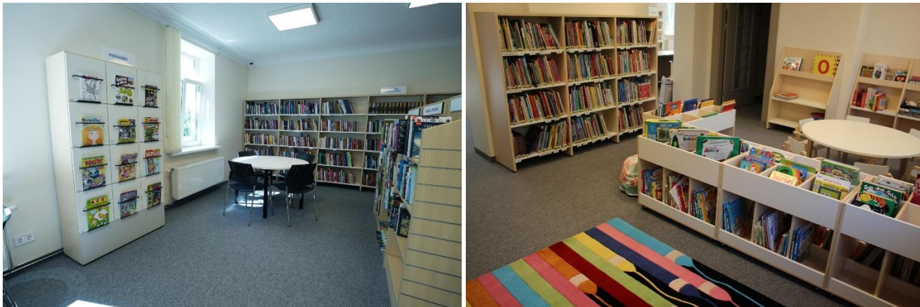
Renovētā Bolderājas filiālbibliotēka

Turpinājās Bolderājas filiālbibliotēkas iekārtošanas darbi, tajā skaitā bibliotēkas norāžu izstrāde un uzstādīšana u. c. noformēšanas darbi. Uz ēkas fasādes tika izvietots RCB logo un uzskatāms uzraksts "Bibliotēka", pie ēkas ieejas izvietots bibliomāts. RCB Bolderājas filiālbibliotēka durvis lasītājiem vērā 2024. gada 21. jūnijā.