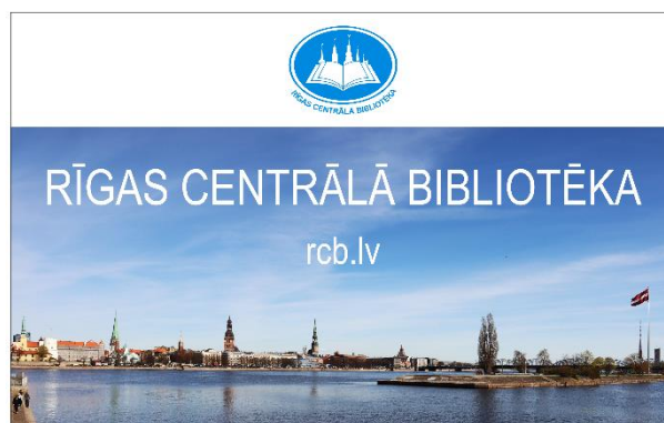
Jaunā RCB lasītāja karte