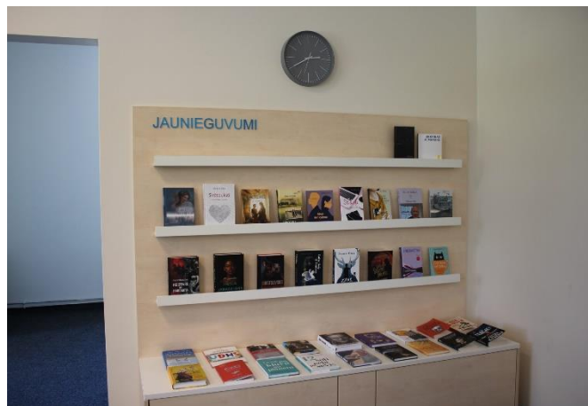
Jaunieguvumu stends Bolderājas filiālbibliotēkā

Tāpēc liela daļa filiālbibliotēku ir atteikušās no jaunieguvumu uzkrāšanas un prezentācijas īpašos pasākumos, tā vietā dodot priekšroku jaunieguvumu sarakstu veidošanai un pašu jaunieguvumu operatīvākai nodošanai lietotājiem – to atzinīgi vērtē arī bibliotēku lietotāji (piemēram, Ilģuciema filiālbibliotēka). Pretēju viedokli savā darba pārskatā izsaka Pļavnieku filiālbibliotēka, kura pēc ilgāka pārtraukuma, līdztekus