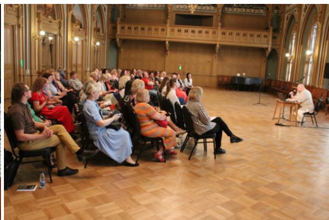
Konference “Helmars Rudzītis. Bellaccord-Electro”