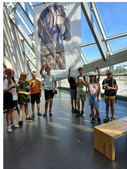
Ekskursija kopā ar filiālbibliotēku "Pūce"