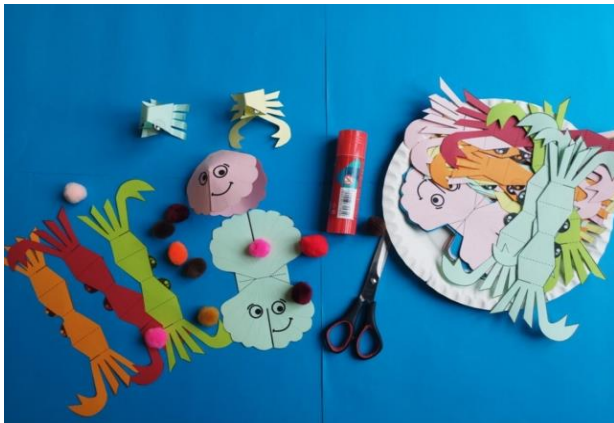
Radošā darbnīca "Jūras iemītnieki" filiālbibliotēkā "Vidzeme"

izvēlētajai tēmai, savukārt, filiālbibliotēkā "Vidzeme" radošās darbnīcas (dažādi praktiski darbiņi, krāsojamās izdales lapas) ir pieejamas visu laiku, bērnam piedāvājot lielāku izvēles brīvību. Bolderājas filiālbibliotēka pārskata periodā novadījusi vairākas ekskursijas dažāda vecuma bērniem, iepazīstinot apmeklētājus ar jaunajām telpām, ar bibliotēkas dārzu un piedāvājot radoši izklaidēties, spēlējot izzinošas spēles svaigā gaisā. Daugavas filiālbibliotēka, izmantojot digitālo rīku kahoot! , bibliotēkārājās stundās