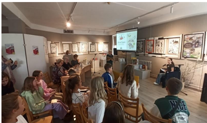
Filiālbibliotēkas "Pūce" organizētā "Nacionālo skalās lasīšanas sacensību" pirmā kārtā

Gatavojoties "Nacionālās skalās lasīšanas sacensību" Rīgas reģionālajam finālam, filiālbibliotēka "Pūce" uzrunāja savus sadarbības partnerus Purvciema un Pļavnieku apkaimju skolu pedagogus un bibliotekārus, lai kopīgi iedrošinātu audzēkņus piedalīties skalās lasīšanas sacensību pirmajā kārtā. Atsaucīgi šo piedāvājumu uzņēma pamatskola BŪSIM, Rīgas 88. vidusskola, Rīgas Purvciema vidusskola un Rīgas Valsts klasiskā ģimnāzija. Pasākums bija labi izplānots – žūrija, atbalstītāji un muzikāli priekšnesumi. Rezultātā Rīgas reģionālajam finālam tika izvirzīti trīs 5. klases audzēkņi.