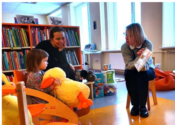
“Mazo rīti” Daugavas filiālbibliotēkā