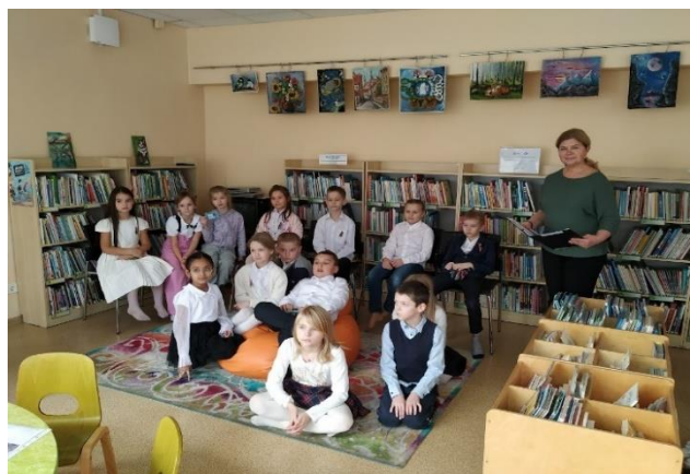
Ziemeļvalstu literatūras nedēļa Šampētera filiālbibliotēkā un filiālbibliotēkā “Strazds”

Filiālbibliotēkā “Pūce” gan lielie, gan mazie lasītāji ar Pūcītes sagatavotiem atraktīviem uzdevumiem ieguva jaunas zināšanas par Ziemeļvalstīm. Izmantojot bibliotēkas krājumā esošos ģeogrāfijas un vēstures materiālus, bērni mēģināja atrast šīs valstis, atrast informāciju par dabu, klimatu, literatūru, kā arī noskaidrot galvaspilsētu nosaukumus, ģerboņus un ekspresvīktorinā to visu apkopot un prezentēt. Ar