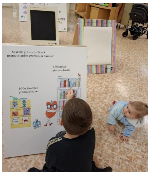
Izstāde “Vai grāmatai ir knābis?” CB BLN