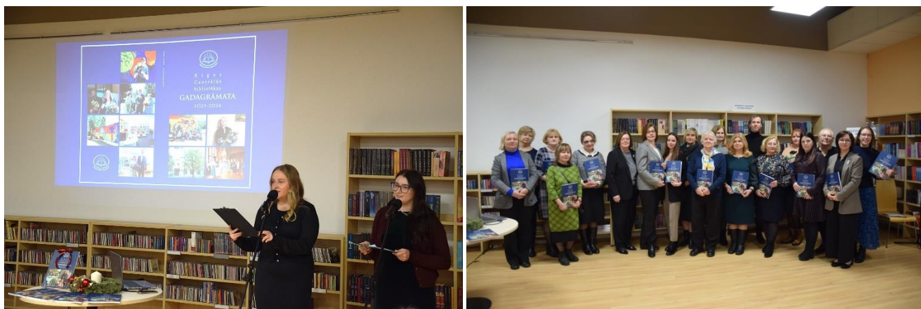
"Rīgas Centrālās bibliotēkas gadagrāmata 2023–2024" atvēršanas svētki

RCB Bibliotēku dienesta eksperti ir vislielākajā mērā iesaistīti RCB izdevējdarbībā : 2024. gadā tika sagatavots un izdots ikgadējais profesionālais izdevums "RCB gadagrāmata 2023–2024".