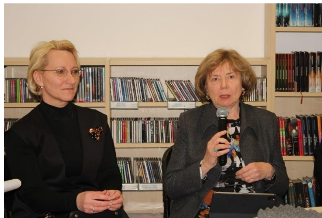
3td.lv e-grāmatu bibliotēkas piecu gadu jubilejas pasākums CB

Sabiedrības, lietotāju viedokļa izzināšana par bibliotēkas darba kvalitāti, to rezultāti (pētījumi, aptaujas, anketas u. tml.); jaunu lietotāju piesaiste