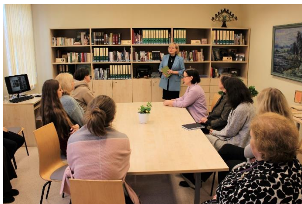
RCB jaunie bibliotekāri tiekas filiālbibliotēkā "Vidzeme"

RCB darbinieku profesionālās pilnveides ietvaros tradicionāli tika organizēts nodarbību cikls RCB darbiniekiem, kam stāžs RCB ir mazāks par vienu gadu. Četrās dienās notika astoņas nodarbības par šādām ar RCB darba tēmām: RCB struktūra un darbība, lietotāju apkalpošana, darbs ar BIS ALISE, RCB krājums, publicitāte, novadpētniecība u. c. Nodarbības notika gan klātienē, gan tika organizētas tiešsaistē MS Teams platformā.