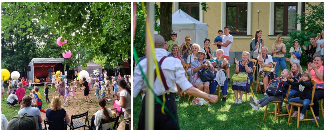
Kultūrpunktu "Strops" pasākumi Bolderājas un Čiekurkalna filiālbibliotēkas dārzā

2024. gadā RCB un filiālbibliotēku pakalpojumu popularizēšanai tika izmantotas vienota stila informatīvās vienlapes. Neliela izmēra afišas un informācijas lapiņas par bibliotēkās notiekošajiem pasākumiem tiek sagatavotas visās filiālbibliotēkās.