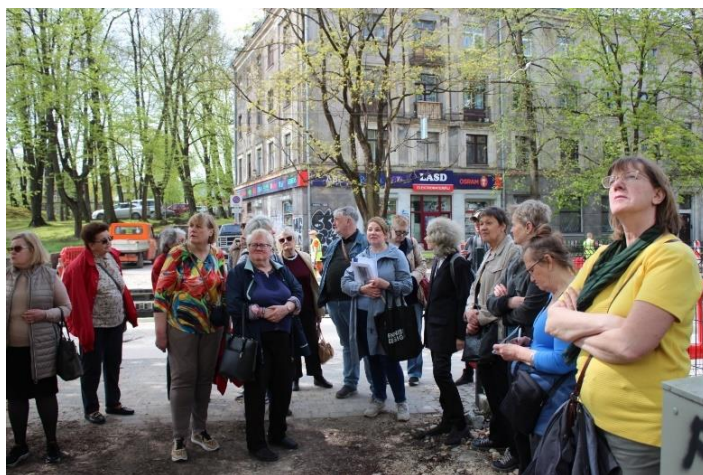
Novadpētniecības ekskursija "Iepazīsim vēsturisko rūpnīcas "Provodņik" ēku" un pastaiga pa Slokas ielu