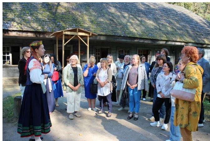
Baltu vienības dienas starptautiskā konference