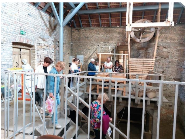
Ekskursija uz Mazjumpravmuižu

Bibliotēkas interešu aizstāvība tiek īstenota regulārā darbā un sadarbībā ar RD (Izglītības, kultūras un sporta komitejas, kā arī citu komiteju deputāti), RVP (IKSD un citu departamentu direktori, nodaļu vadītāji un darbinieki). RCB direktore regulāri tiek ar amatpersonām un darbiniekiem, kuru kompetencē ir kultūras iestāžu pārraudzība, lai stāstītu par RCB darbu, problēmām un sasniegumiem. RCB aktīvi iesaistās RVP stratēģiski svarīgu attīstības dokumentu izstrādē (Rīgas valstspilsētas pašvaldības kultūrpolitikas pamatnostādnes 2025.–2028. gadam, Rīgas attīstības programma 2022.–2027. gadam), kur bibliotēka tiek atspoguļota kā nozīmīga Rīgas kultūras dzīves sastāvdaļa. Regulāras un ilgstošas interešu aizstāvības un sadarbības rezultātā RVP realizē mērķtiecīgu RCB tīkla infrastruktūras attīstību un pilnveidi: 2022. gadā atvērta Āgenskalna filiālbibliotēka, 2023. gadā pēc renovācijas atvērta Torņakalna filiālbibliotēka, 2024. gadā pēc renovācijas atvērta Bolderājas filiālbibliotēka, 2025. gadā plānota filiālbibliotēkas “Rēzna” atvēršana pēc renovācijas. 2025. gadā plānots renovācijas darbus turpināt citās RCB struktūrvienībās/filiālbibliotēkās. RVP regulāri atbalsta RCB dalību RVP sabiedrības integrācijas projektos, tāpat RCB tiek atzinīgi novērtēta kā sadarbības partneris dažādos projektos.