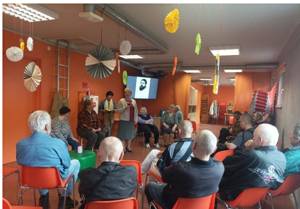
Uzvedums “Dzied sirds un spēlē visa Rīga” Dienas centrā

Kā katru gadu RCB filiālbibliotēkās bezdarbniekiem tika piedāvātas individuālas konsultācijas datoru izmantošanā, konsultācijas par interneta resursu izmantošanu darba meklēšanā un dzīvesvietas meklēšanā, piedāvāti tīmekļvietņu saraksti un informatīvās mapes ar dažādu dokumentu iesniegumu paraugiem (CV, iesniegumu paraugi sociālajiem dienestiem), veiktas izdrukas. Āgenskalna filiālbibliotēka sadarbojās ar Rīgas Sociālā dienesta teritoriālo centru “Āgenskalns”, kas atrodas vienā ēkā ar bibliotēku. Tās klienti ik dienu bibliotēkā izmanto datorpakalpojumus izziņu sagatavošanai, banku kontu pārskatu izdrukai u. c. ĀAP Rīgas patversmes Dienas centrā katru trešdienu tika sniegtas datorkonsultācijas darba