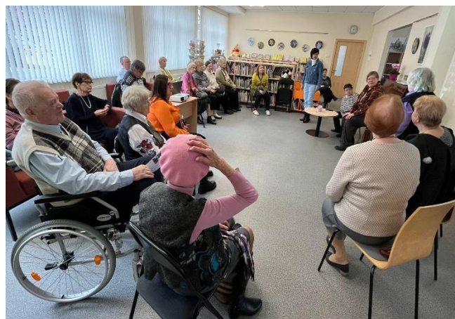
Drāmas kopas "Saulespuķe" izrādes RCB filiālbibliotēkās